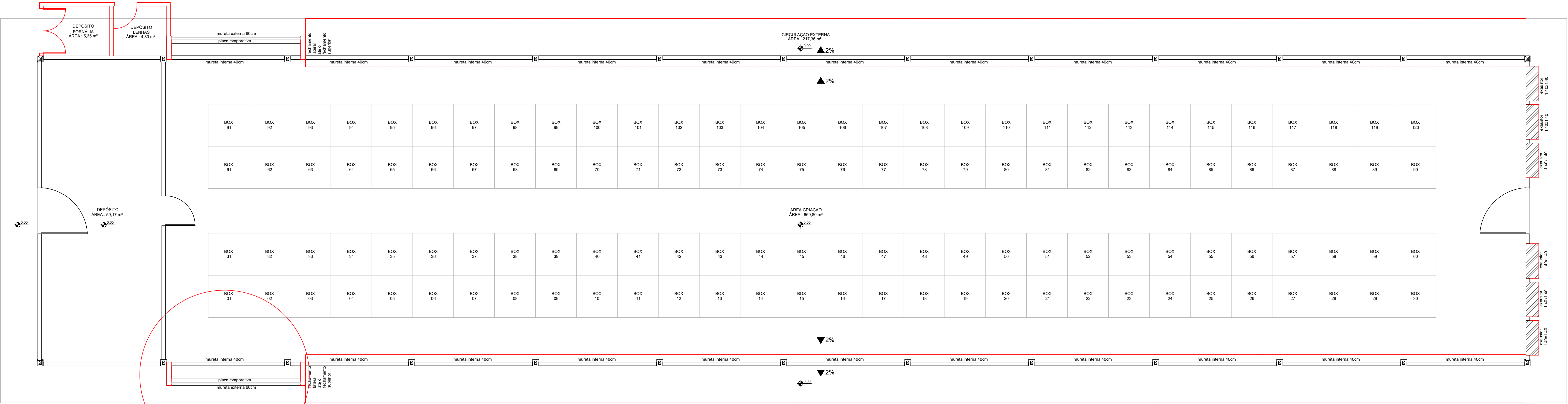
PLANTA BAIXA AVIÁRIO 01 – CONSTRUIR ESCALA.: 1/75